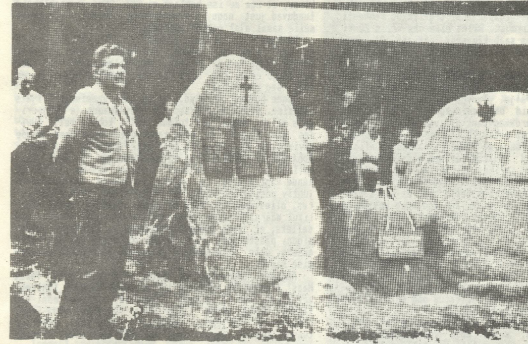
30. juulil 1989 Kautlas

uusi avalikuks tulnud ohvrite nimesid. Põletati ligikaudu 25 talu (sh Ardu koolimaja ja meierei).