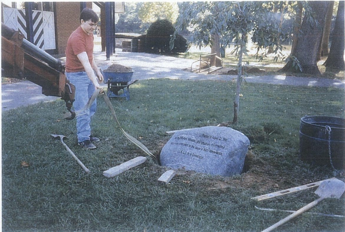
KIVI PAIGUTAMINE BALTI VABADUSEPUU KÕRVALE