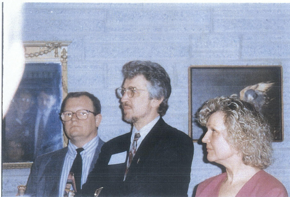
ELLA of CT TULUÜRITUS BOLTONIS APRILLIS 1994. a. VASAKULT LEEDU SUURSAADIK WASHINGTONIS ALFONSAS EIDINTAS, LÄTI SUURSAADIK WASHINGTONIS OJARS KALNINS, ILVI JÕE-CANNON