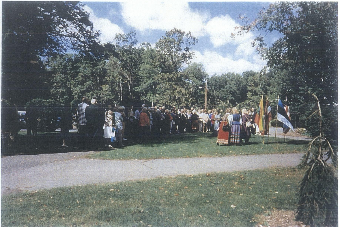
VAADE BALTI RIIKIDE TÄIELIKU İSESEİSVUSE TÄHİSTAMİSE ÜRİTUSELE ELİZABETHI PARGIS, HARTFORDIS, SEPTEMBRIS 1994. a.