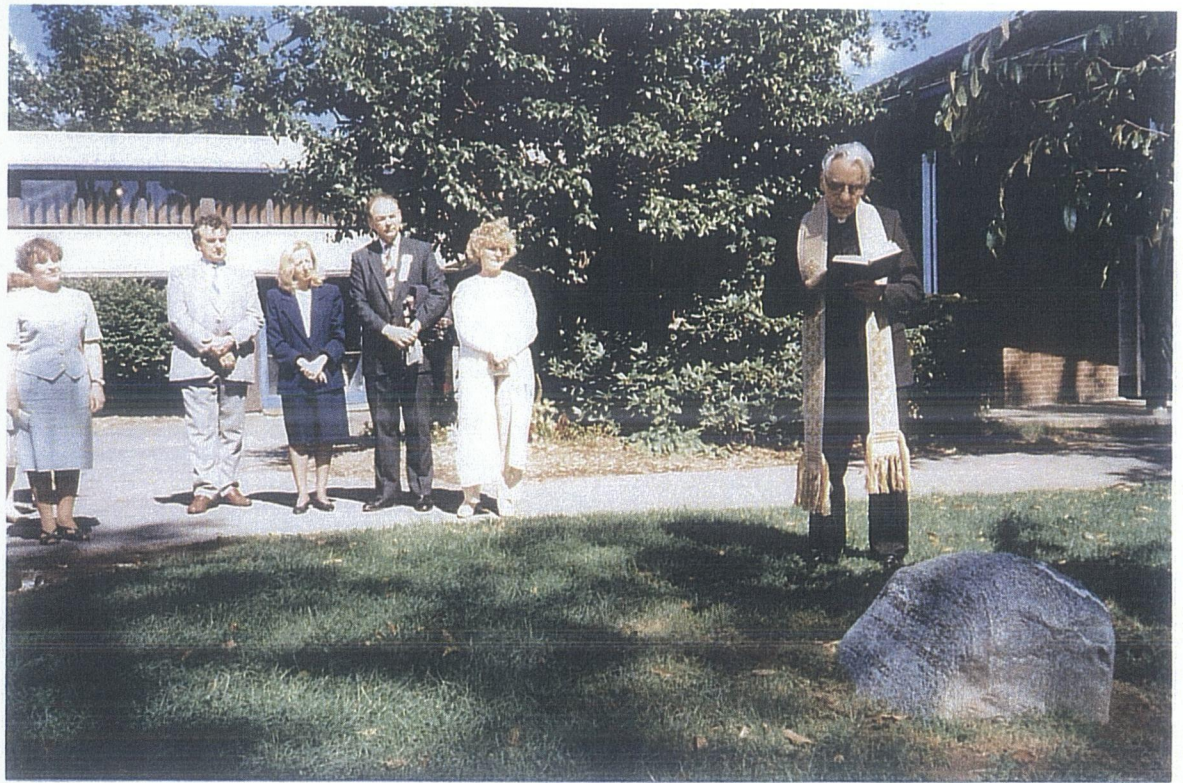
LEEDU SOOST ROOMA KATOLIKU PREESTER PÜHITSEB KIVI SEPTEMBRIS 1994. a.